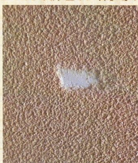
塗り壁に傷を付けた