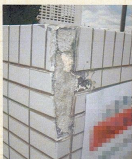
タイルを欠損させた