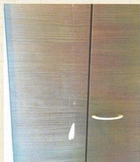
クローゼット扉に傷を付けた

その他：クッションフロアー・タイル・フローリング・カーペット・天井・壁・ドア・障子 等々