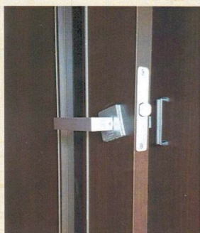
ドアの取手を壊した