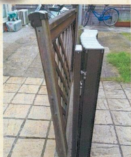
フェンスを歪めた

その他：ブロック塀・フェンス・店舗のテント・看板・外壁・門扉・タイル・雨樋・庇・瓦 等々