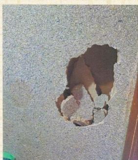
内壁に穴を開けた